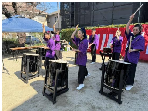
春日太鼓 翔音によるパフォーマンス