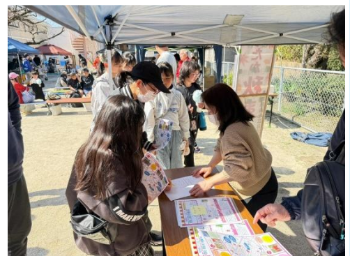
スタンプラリー受付の様子